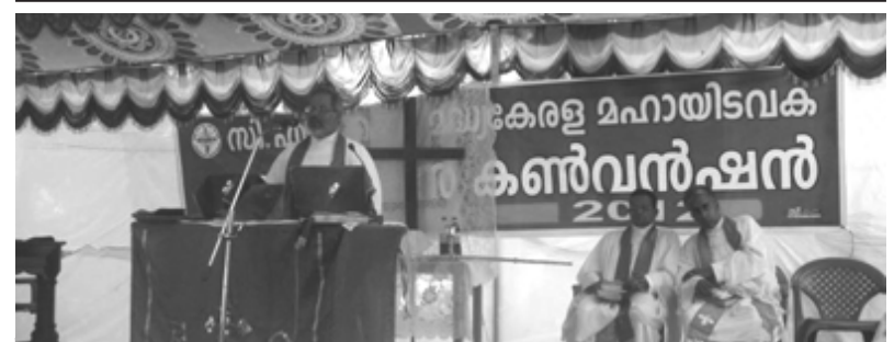
അടുർ മിഷൻ കൺവൻഷൻ 2012